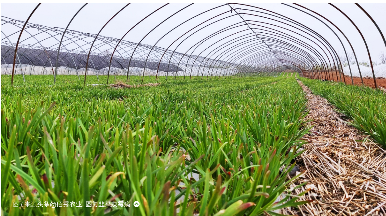
图为韭菜灰霉病

上文提到，根据天祥集团食品部编写的《2021年国内食品安全抽检情况汇总分析报告》，农残超标比例最高的农药是腐霉利，占比14.86%。但毒死蜱受到的关注更多，它毒性较高，存在持久性污染，腐霉利则是低毒农药。