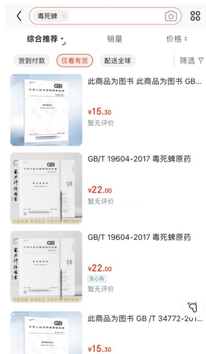
京东上搜索毒死蜱，京东截图