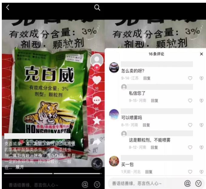
抖音上用户发视频引导私下售卖，抖音截图

互联网平台的农药售卖环境方面，短视频平台比较相似，搜索限用农药后会出现不同内容的视频，包括相关新闻、农药使用指导，也有部分引导私下交易。在京东搜索限用农药，出现的通常是相关的食品安全国家标准书籍，淘宝则会出现其他效果类似的农药产品，前者更具警戒性。拼多多的环境最差，搜索时搜索框下方会出现一系列补充关键词，如搜索甲拌（磷），下方就会出现“甲拌磷”、“甲拌磷颗粒 地下害虫”、“甲拌磷 最毒”等。即使不一定有对应的产品在出售，但在搜索时，平台的关键词推荐会主动为买家提供规避敏感词的搜索方式。