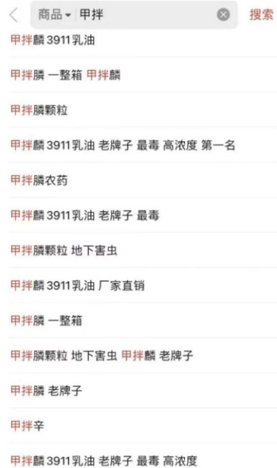
拼多多上搜索“甲拌（磷）”